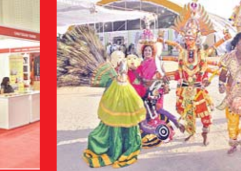
లావెల్ మార్ట్లో ఏర్పాటు చేసిన సాంస్కృతిక కార్యక్రమంలోని ఓ దృశ్యం