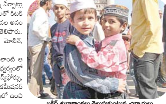
బక్రీద్ శుభాకాంక్షలు తెలుపుకుంటున్న చిన్నారులు