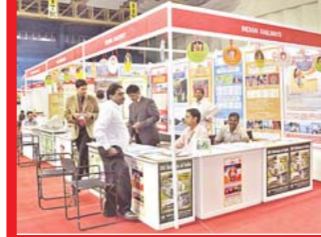
'కోట్ల' ఇండోర్ స్టేడియంలో ఏర్పాటు చేసిన లావెల్ మార్ట్లోని స్టాల్