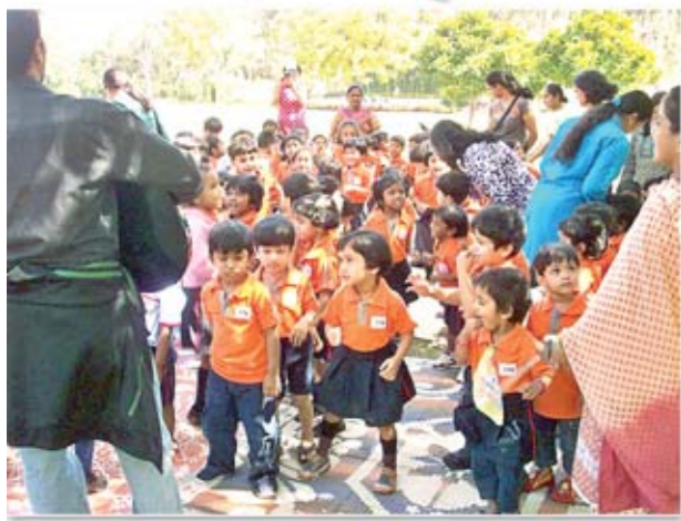
మూజిక్కు అనుగుణంగా నృత్యం చేస్తున్న బుడతలు బోటింగ్లో సంతోషాన్ని అస్సాదిస్తున్న చిన్నారులు

కొత్తగా ప్రవేశపెట్టిన బోటింగ్కు అనూహ్య స్పందన