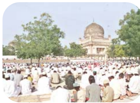
కులీ కుతుబ్షాహి టూంప్ వద్ద ప్రార్థనలు